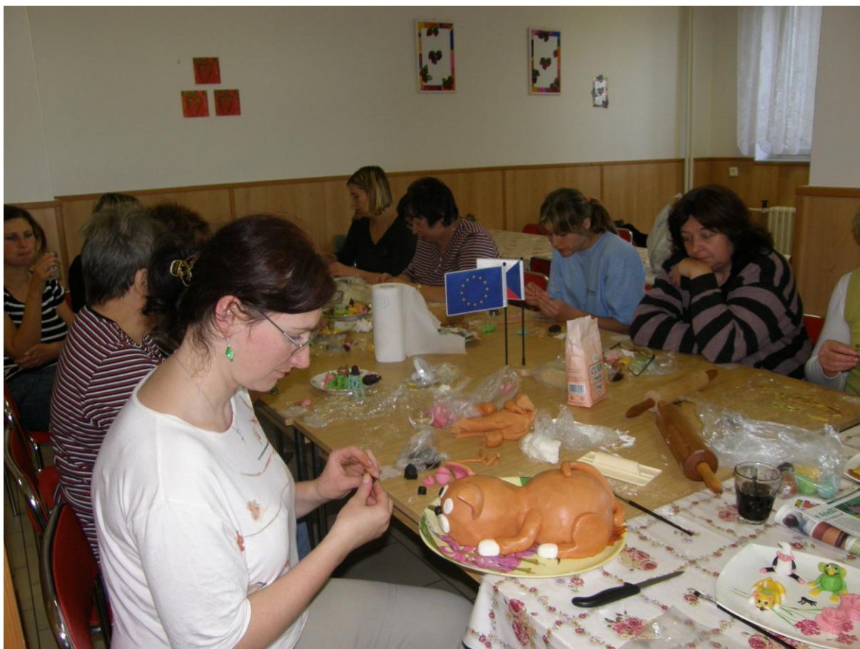
Cukrářský kurz ve Lhotách u Potštejna