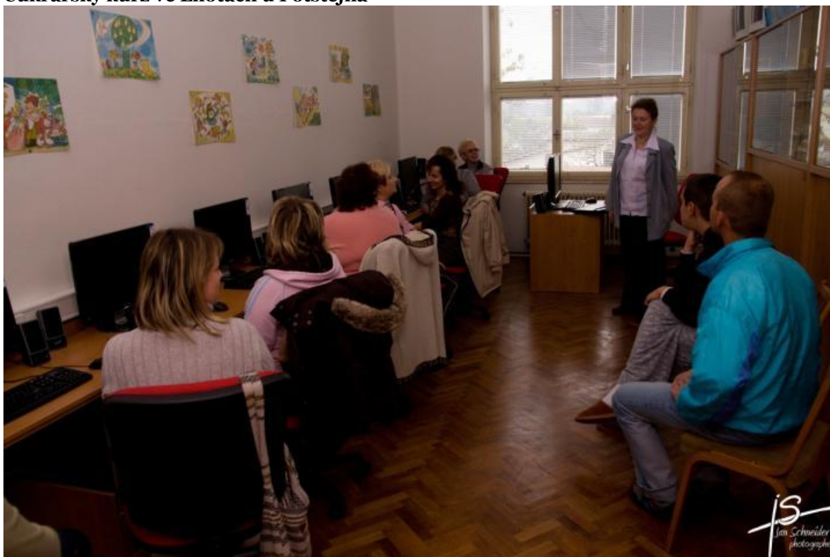
Kurz PC v Čermné nad Orlicí